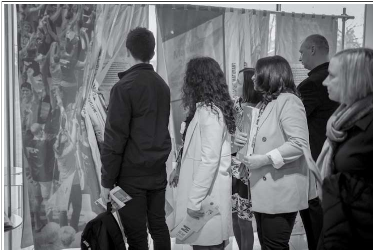
Z zanimanjem ob ogledu razstave (Brdo pri Kranju, 15. 4. 2025,).

Arhitekturno oblikovanje zato omogoča prilagodljivo postavitve potujoče razstave v različnih izobraževalnih in drugih razstavnih prostorih. Razstava je modularno zasnovana, kar olajša prenos in postavitve na različnih lokacijah po Sloveniji. Sprva je nov, inovativen način tiska na svetleče razstavne površine prinesel nekaj težav, ki so bile v nadaljevanju odpravljene.