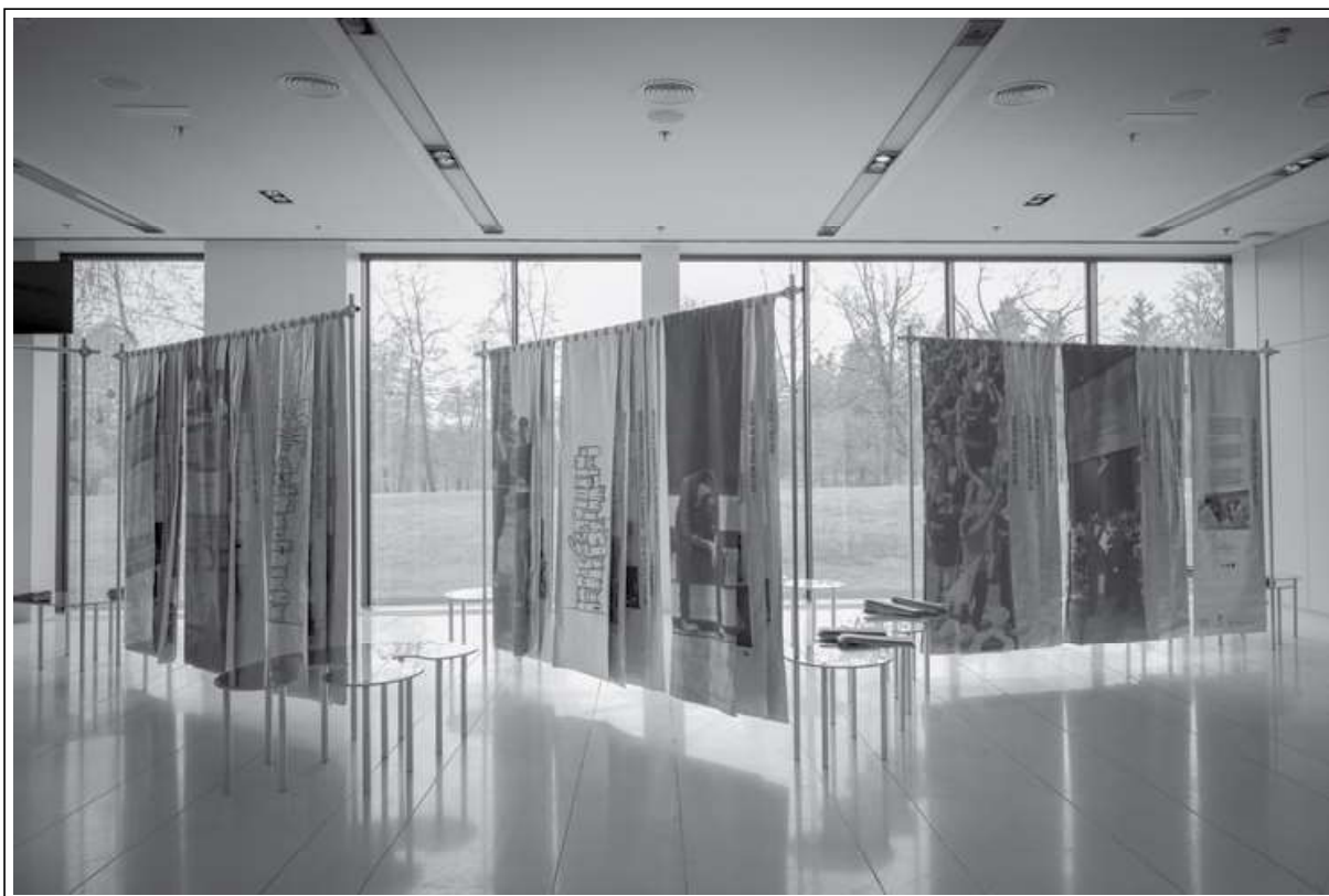
Razstava Matura kot čarobna palica, ob slovesnem praznovanju 30-letnice ponovne uvedbe mature v Sloveniji (Brdo pri Kranju, 15. 4. 2025,).