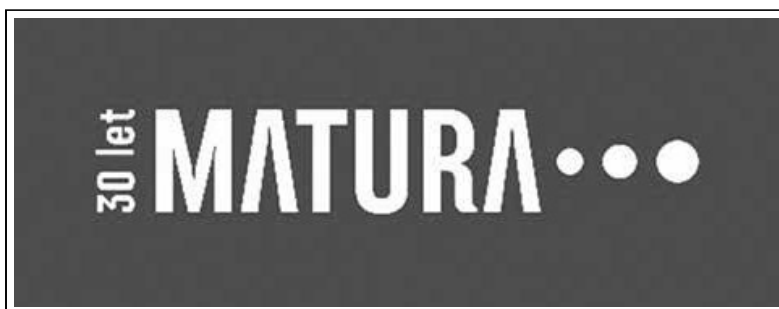
Logotip razstave matura (Irena Gubanc, hrani SŠM).

Na razstavnih panojih je ob povednih izbranih fotografijah besedilo vsebine predstavljeno tako, da spominja na šolske zapiske ali izpiske – s poudarjenim izborom pomembnih pojmov. Grafična oprema razstave je delo ilustratorke in oblikovalke Irene Gubanc. 7