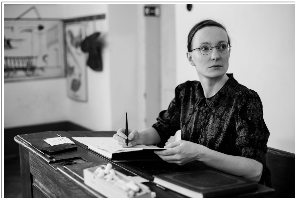
"Kaj bo z našo to mladino?" (SŠM, fototeka, foto: Urška Boljkovac).