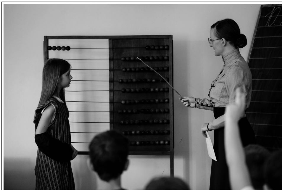
"Na vsaki šibki je deset kroglic, to je ena desetica.".

Kljub prepričanju nekaterih in vprašljivemu slovesu učnih ur v stilu: »Ko te bodo topli in ustrašovali, boš videl, kako je bilo včasih grozno v šoli,« je namen učiteljev v Slovenskem šolskem muzeju, da učenci na prijeten način spoznajo staro šolo ter da se v muzej z veseljem še kdaj vrnejo. Seveda je del izkustva tudi upoštevanje pravil, preživljanje kazni in spoštovanje avtoritete učitelja nekoč. Vse to pripomore, da je izkustvo res močno in ostane v spominu še dolgo časa.