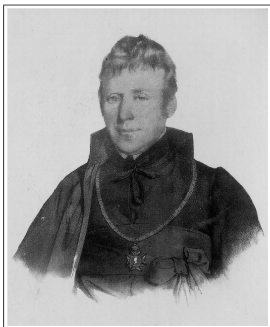
Jožef Kalasanc Likavec

Rojen je bil leta 1773 na gradu Žinkovy na Češkem. Po končani gimnaziji je opravljal delo pisarja pri vojaški upravi v Pragi. Leta 1798 je bil posvečen v mašnika ter stopil v katoliški red piaristov, ki so se ukvarjali predvsem z izobraževanjem revnih otrok. Učiteljski poklic je najprej opravljal na normalkah v več krajih po Češkem. Kot profesor filozofije je poučeval v Löwenburgovem zavodu na Dunaju, od koder je odšel v Prago poučevat retoriko, zatem pa zopet filozofijo na piaristovsko filozofsko učilišče v Mostu na Češkem. Leta 1809 je bil med ustanovitelji filozofskega učilišča v Brnu, kjer je v naslednjih letih tudi poučeval. Kar dvajset let, od 1815 do 1835, je bil profesor teoretične in praktične filozofije na filozofskem učilišču v Gradcu. Doktorski naziv iz filozofije je prejel leta 1825.