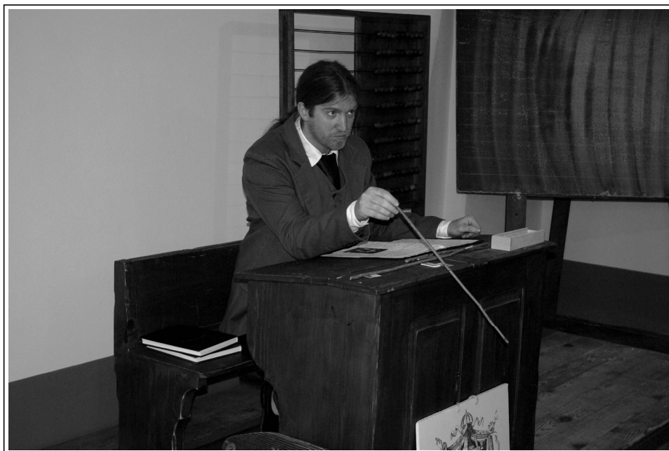
"Še malo se namrščím in zažugam s šibo, pa bo mir. Škoda, da je ne smem večkrat uporabljati.".

Pri mlajših je bila gostota besed manjša, glas mirnejši, tišji in gibí počasnejši. Tudi obrazna mimika je bila milejša in manj stroga. Starejši ko so bili obiskovalci, več strogosti sem si lahko privoščil.