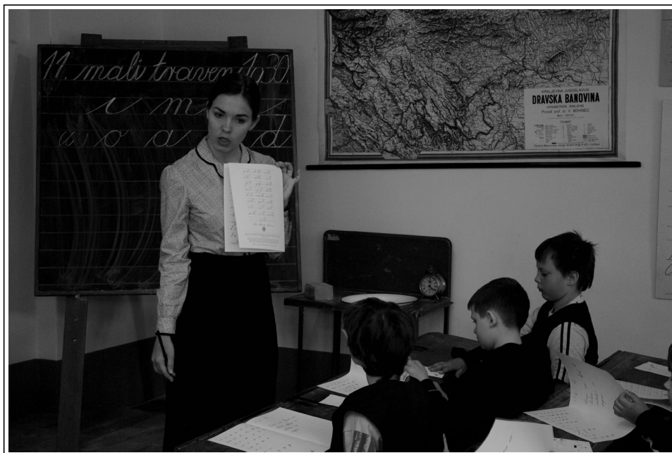
"Za domačo nalogo desetkrat napišite vsako črko. Levaki pa kar stokrat!" (SŠM, fototeka, foto: Marjan Javoršek).

Lepomisje je moj predmet, tudi zares, ljubim lepo zapisano besedo. Učenci so mirno, nekoliko prestrašeno sedeli v klopih in poskušali odgovarja-