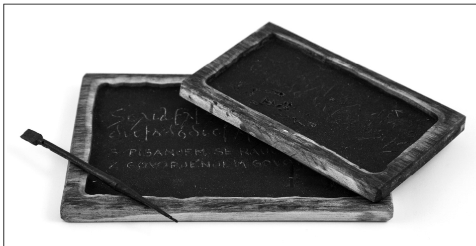
Replike tablic in stilusa (hrani SŠM, fototeka, foto: Urška Boljkovac).

Glavni namen šolanja je bilo pridobivanje splošne izobrazbe, končni cilj pa postati govornik. Izobraževanje, ki so ga bili deležni v veliki meri le dečki, je bilo razdeljeno na tri stopnje.