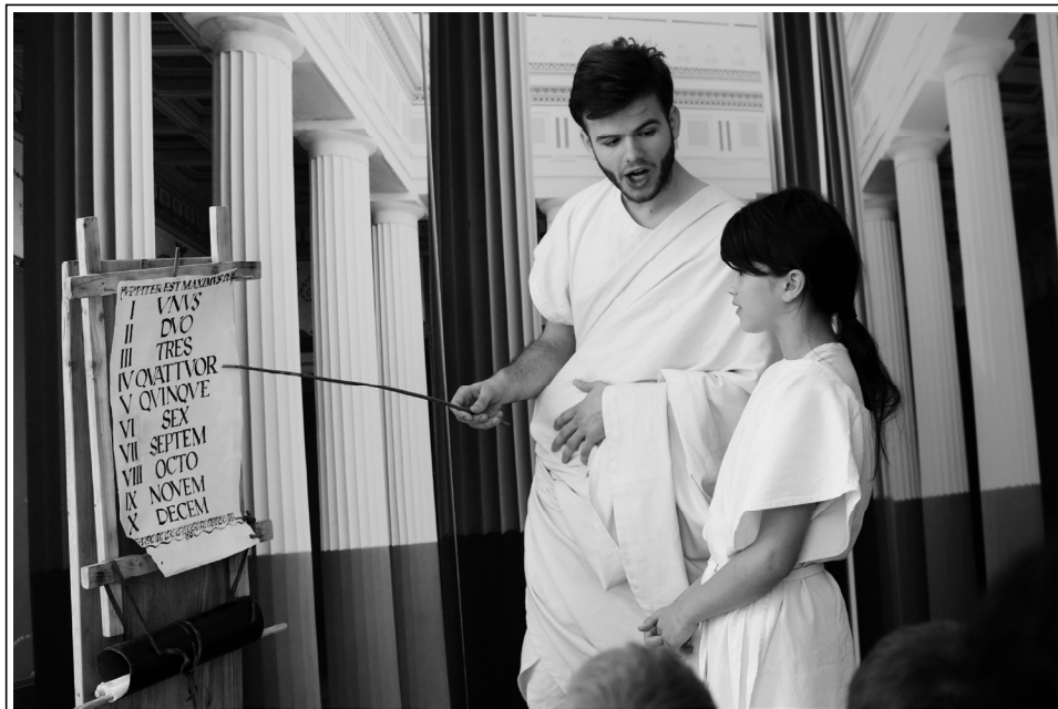
Učna ura Antična Emona v Slovenskem šolskem muzeju (hrani SŠM, fototeka, foto: Urška Boljkovac).

gistrovim vodstvom se obiskovalci seznanijo z načinom vzgoje, poučevanja in discipline, značilne za antiko. Spoznavajo osnove latinskega jezika v pisavi in izgovorjavi (klasični način izgovorjave, kjer se »c« v vseh primerih izgovori kot »k«). Naučijo se rimska števila, ki jih zapisujejo, kakor nam pričajo zgodovinski viri, na voščeno tablico s kovinskim stilusom . V ta namen smo v Slovenskem šolskem muzeju pripravili replike tablic in stilusa po originalih, ki so ju izkopal na enem od antičnih najdišč, ki jih v sebi skriva arheološko bogato mesto Ptuj. Med poukom, ki traja približno tri četrt ure, udeleženci spoznajo tudi pomembnejše latinske pregovore in latinska imena za mesece v letu. Nadvse zanimive so zgodbe iz antične zgodovine in bogato razvejane rimske mitologije, ki jih zavzeto pripoveduje magister . Vsak udeleženec učne ure prejme poleg replik tablice in stilusa tudi času prikladno repliko oblačila – rimsko tuniko, kakršno so nosili otroci v rimski državi. Oprava, pripomočki, magister , latinska govorica ter okolje, v katerem poteka učna ura, pričarajo prijetno antično ozračje.