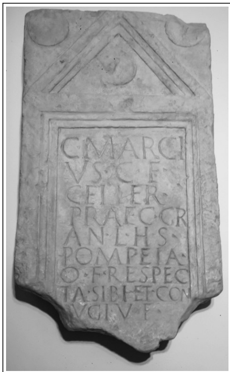
Replika nagrobnega kamna za Gaja Marcija Ceilerja.

kakšne pripomočke so otroci uporabljali pri učenju: pisala (lat. stylus ), povoščene tablice (lat. tabula cerata ), knjige v obliki zvitkov (lat. volumen ) itd.« 16