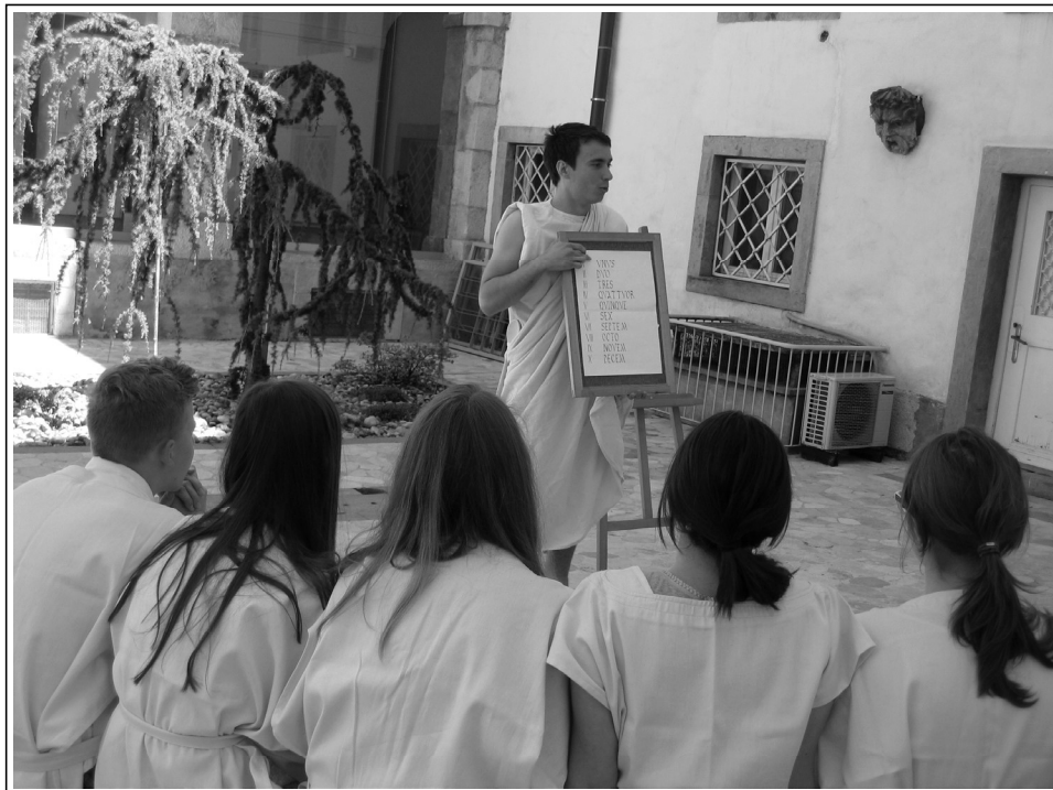
Učna ura Antična Emona v atriju uršulinskega samostana v Ljubljani.

časa, ko je vladarica Marija Terezija uzakonila pouk. Ob sodelovanju s klasičnim filologoma se je začel pisati scenarij za učno uro iz časa antike. Obhajanje dvatisočletnega jubileja mesta Emona pa je spodbudilo realizacijo načrtovanega projekta. Učna ura je tako zasnovana na virih, ki nam odkrivajo način antičnega izobraževanja. Prizadevanja so šla v smeri, da bi obudili pouk, kakršen je bil verjetno pri nas pred dva tisoč leti. Poleg manjših odstopanj, za katera pravzaprav niti ne moremo vedeti, ker (še) nimamo podrobnejših virov, pa je gotovo eno od večjih to, da na učnih urah ne predstavljajo večine dečki, kakor je bilo značilno za antiko. Učna ura je primerna za drugo in tretjo triado osnovne šole, srednješolce in odrasle. Do konca leta 2020 je v šestih letih obstoja doživela 176 uprizoritev.