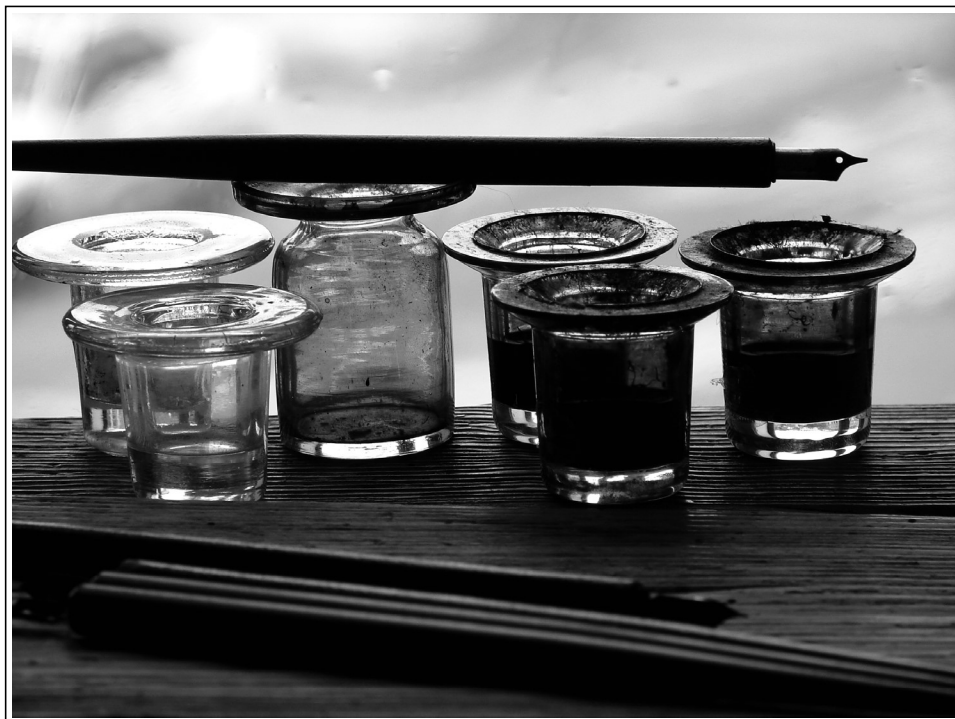
Kovinska peresa in črnilniki (SŠM, fototeka, foto: Polona Demšar).

nosti lepopisa kot samostojnega učnega predmeta. 30 »Marsikateremu učitelju so zastareli in neuporabni podrobni učni načrti vodnik v njegovem delu na šolskem polju. Praktičen učitelj mora tudi nekaj svojega iz življenja vzetega in na podlagi lastnih izkušenj vpeljati v šolo, pripravljati se mora do subjektivne samostojnosti in samozavesti in ne biti navezan na možgane drugih ljudi, ki so večkrat zastareli: saj za svoje delo je odgovoren le narodu in nikomur drugemu.« 31 Glavni očitki so se dotikali pomanjkanja praktičnosti in uporabnosti v vsakdanjem življenju. »Vsak praktičen učitelj zamore izvajati iz svojih lastnih izkušenj, da je lepopis kot predmet, če ne v srednji vsaj v višji stopnji, odveč. ... Praktičen učitelj ne bo motril svoje pozornosti le pri uri lepopisja, temveč pri vseh pismenih izdelkih. Kaj mi pomaga, če učenec v lepopisnice piše lepo in čedno, če pa te lepote in čednosti ne zna izvajati v pismenih izdelkih, kajti iz pismenih izdelkov se spozna učenca, katerega pripravljamo za praktičnega člana človeške družbe v življenju, ali bo pridobil ono, kar od njega zahteva bodoče življenje.« 32 V nadaljevanju članka avtor utemeljuje svoje mnenje, da bi na višjih šolskih stopnjah ure lepopisa morale