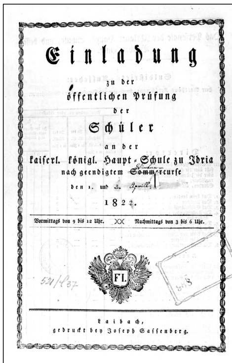
Povabilo na javno skušnjo iz leta 1822, naslovna stran (SŠM, knjižnica).